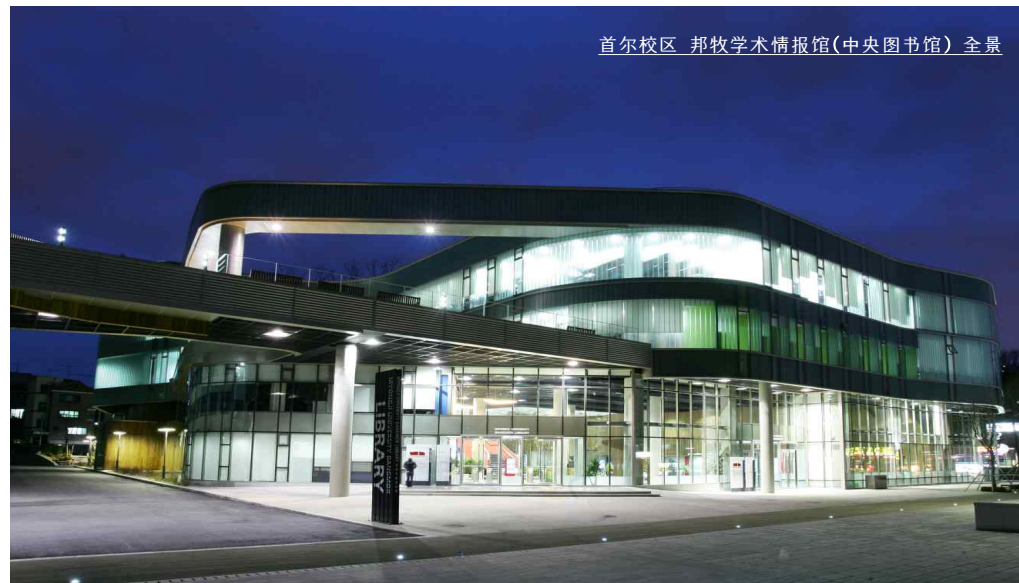
首尔校区 邦牧学术情报馆(中央图书馆)全景

明知大学建立于1948年，现有两个校区。一个位于韩国首都-首尔，一个位于教育都市-龙仁，是一所名门私立大学之一。自从建校以来，我校培养了13万余名知识人。明知大学以多种多样的、实质性的国际化项目，使学生充分感受到明知正在走向世界。明知一方面面向所有学生提供在通往世界的道路上丰富地享受优越环境的机会，另一方面以最高水准的师资队伍与教学计划、尖端教育设施来确保培养世界所需人才的教育基本设施。