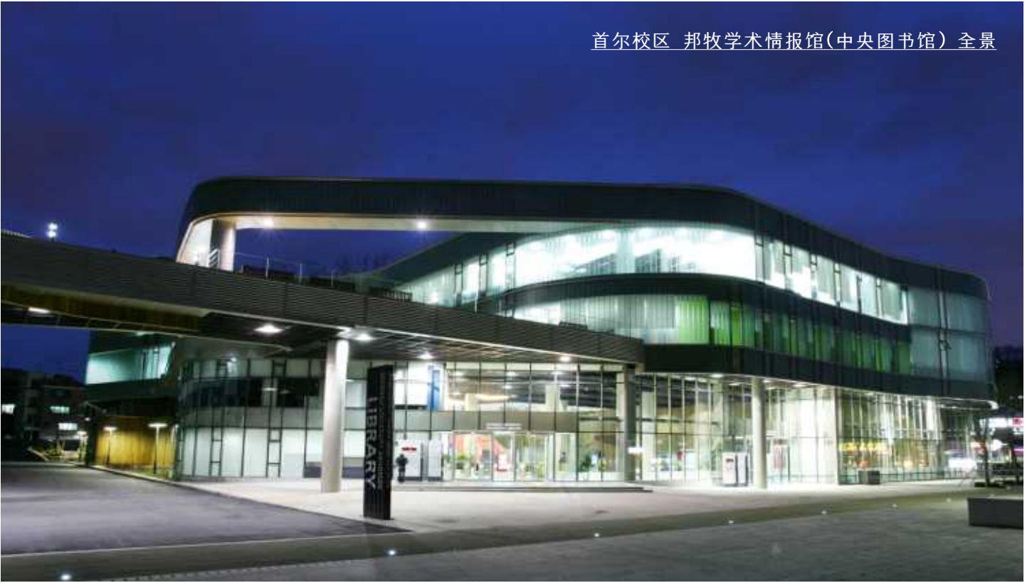
首尔校区 邦牧学术情报馆(中央图书馆) 全景

明知大学建校于1948年，现有两个校区。分别位于韩国首都-首尔和教育都市-龙仁，是一所名门私立大学。自建校以来，培养了13万余名知识人。明知大学以多种多样的、实质性的国际化项目，让学生‘在明知感受世界，从明知走向世界’。一方面向所有学生提供通往世界道路上所需的丰富资源、优越环境；另一方面以最高水准的师资队伍、教学计划和尖端教育设施来确保培养世界所需人才。